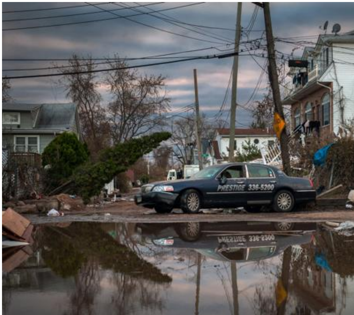
Midland Beach op Staten Island kreeg het hard te verduren van de storm Sandy.