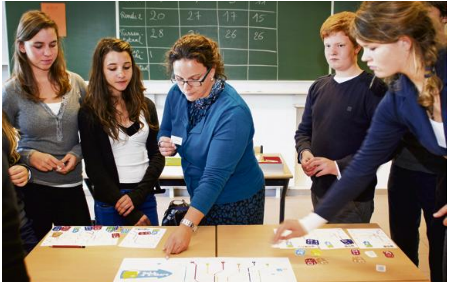
Leerlingen proberen het educatieve pakket uit. Antidepressiva mogen maar een deel zijn van het totaalaanbod.

Gaat het slecht met de gemoedstoestand van de Vlaamse jongeren? ‘Waarschijnlijk ligt het aantal jongeren met psychische problemen een stuk hoger dan de 30.000 jongeren die antidepressiva slikken’, zegt Boydens. ‘Er zijn immers ook andere behandelingen mogelijk. Maar de cijfers van